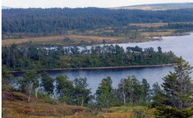
Dinganeset ved Skalstuvatnet.

Siden sagaens beretning ble allment kjent her i forrige århundre ved Oluf Ryghs oversettelse og senere i Nordahl Rolfsens bok «Våre fedres liv» har interessen våknet om spørsmålet. Men de mange gjetninger om stedet har vært overflatiske av ikke lokalkjente folk og uten nærmere undersøkelser.